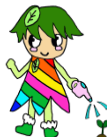
イメージキャラクター ななちゃん

本校では、児童生徒が日頃の学習の成果を発表したり、披露したりする機会を設けています。作品や作業製品、ホームページ等をご覧ください、本校及び児童生徒への理解を一層深めていただけたらと思います。