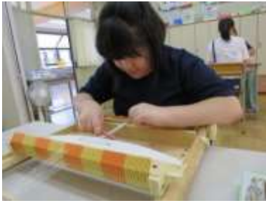
織り機 | 手芸グループ