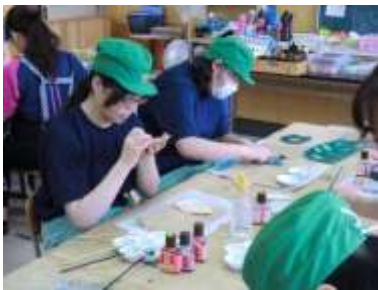
作業の様子 | 染色