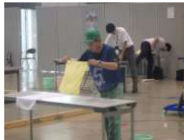
作業技能大会 ビルクリーニング テーブルクロス