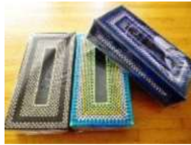
ボックスティッシュ ケース メッシュ手芸 グループ