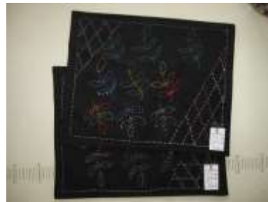
ランチョンマット