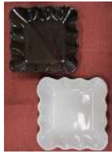
波皿 平成 29 年度 特別支援学校 作業技能大会 銀賞