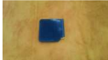
マネークリップ 平成 29 年度 特別支援学校 作業技能大会 銅賞