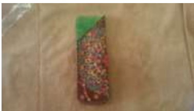
ふたなしペンケース