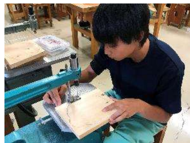
なべしき | 糸のこ