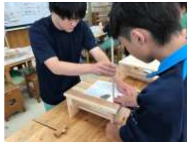
べんり台 | ダボあて