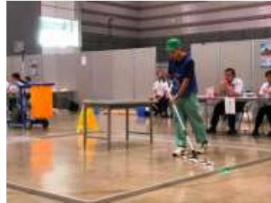
作業技能大会 ビルクリーニング ダスタークロス