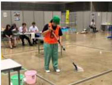
作業技能大会 ビルクリーニング モップ掛け