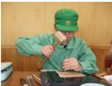
作業の様子 | 刻印