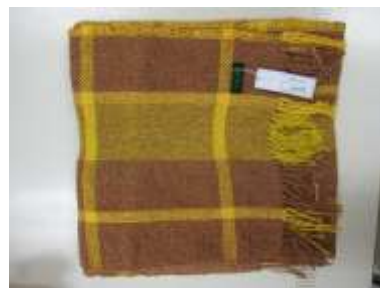
ストール 平成 29 年度 特別支援学校 作業技能大会 最優秀品質賞