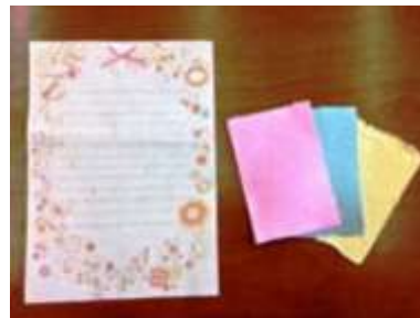
牛乳パックの リサイクル | リサイクルグループ