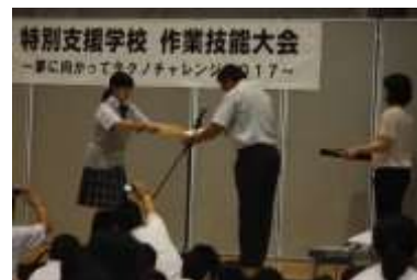
ビルクリーニング 平成 29 年度 特別支援学校 作業技能大会 審査員特別賞