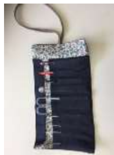
ペンケース | 内側