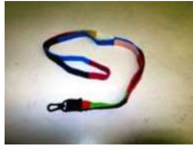
ストラップ 手芸グループ