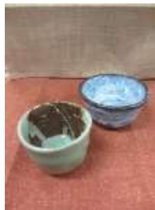
ろくろ・ 手びねり器