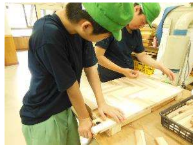
テーブル | 仕上げ