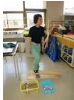
缶つぶし リサイクルグループ