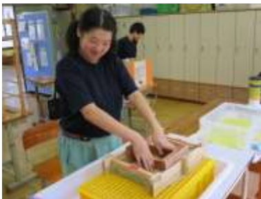
紙漉き リサイクルグループ