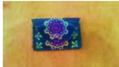
ふたつきカードケース