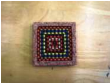
コースター メッシュ手芸 グループ