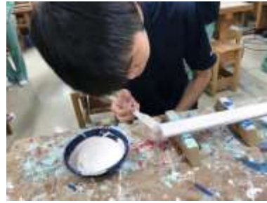
ショコラック | 塗装