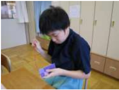
メッシュ手芸 メッシュ手芸 グループ