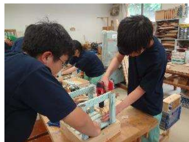
チョイス | 組立