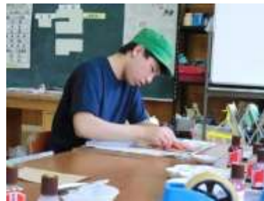
作業の様子 | 染色