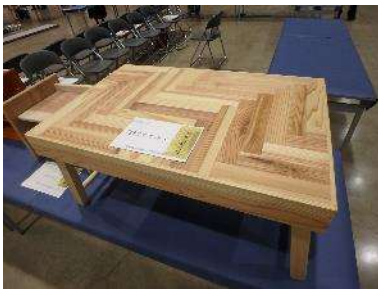
折りたたみテーブル 平成29年度 特別支援学校 作業技能大会 最優秀品質賞