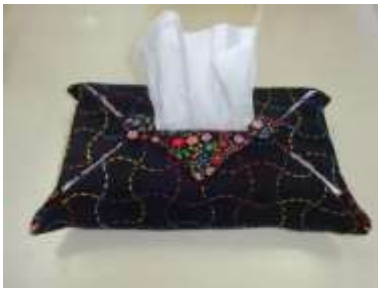
刺し子ティッシュ ケース 平成 29 年度 特別支援学校 作業技能大会 最優秀品質賞