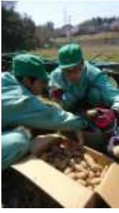
ジャガイモ植え付け